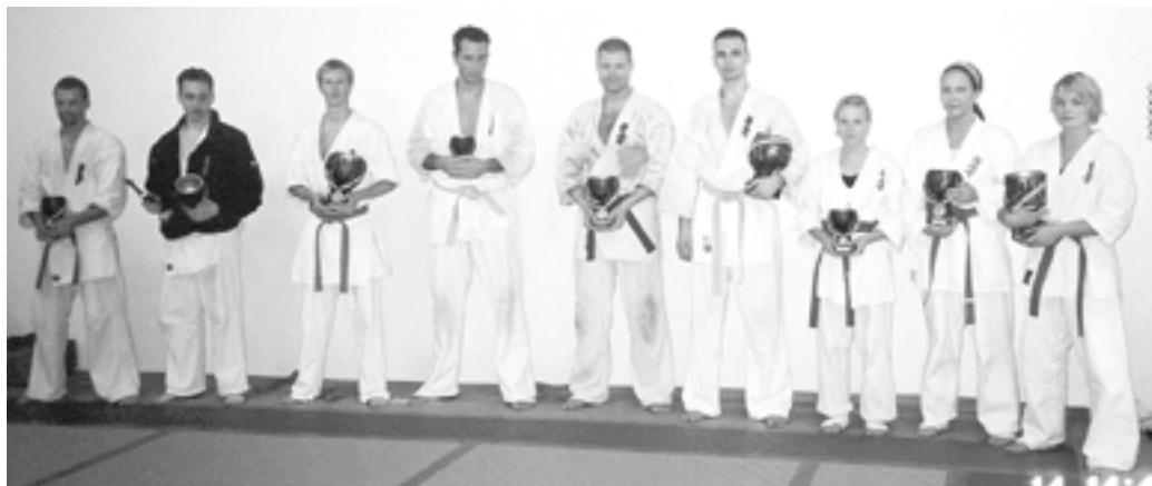
Pristagarna, trötta med nöjda.

Det var en bra tävling och bra klass på de tävlande! Deltagarna blir bättre och bättre, trots att det är en "nybörjartävling". Nytt för denna gången var att domarna hade skärpt bestämmelserna, vad det gäller "tillåten kontakt" och premierade teknik, upprepande av teknik som inte blockerades gav poäng. Till exempel gav ett upprepat antal lowkicks i följd utan blockering, poäng. Trots att de kanske inte "gav effekt". Svårt att döma på de viset. Mycket handlar om personlig uppfattning, men jag tyckte att domarna gjorde det bra.